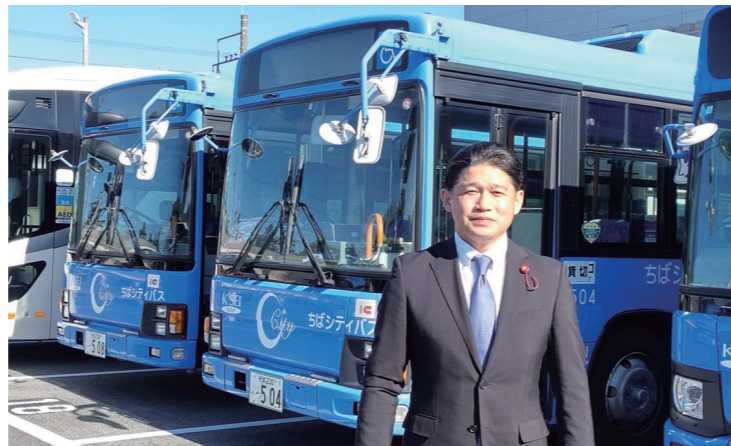
「ちばシティバス株式会社」様を訪問し実状を聴取

その結果、新年度予算には「市民の生活交通として必要なバス路線の維持確保のため、路線バス事業者を対象に運行する費用を助成する」予算(7,500万円)が計上されました。予算計上されたことは大きな前進ですが、地域公共交通の問題は将来にわたる重要課題です。今後とも、事態の改善に向け取り組んでまいります。