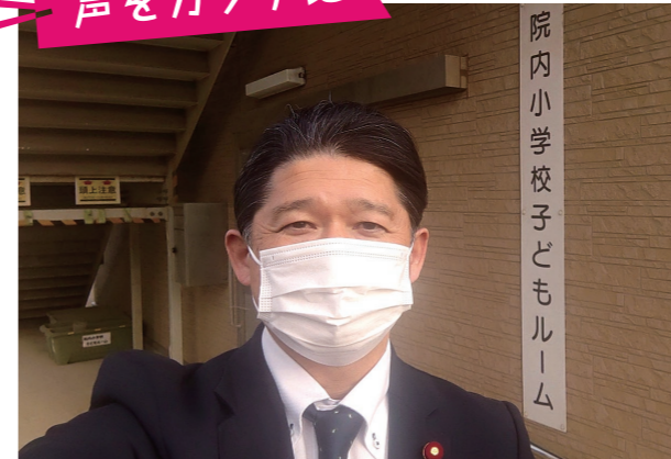
Wi-Fi整備された子どもルームへ