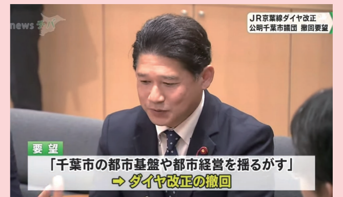
千葉テレビ放映の様子(1月22日)

そうした中、2本の快速電車が復元するなど、全国的にも異例となるダイヤの再改正が行われました。また、ダイヤ復活が具体化されるよう市及び県内の経済団体等による調査が行われることとなり、その第一弾としてWEBアンケートが実施されております。是非ご協力をお願い致します。