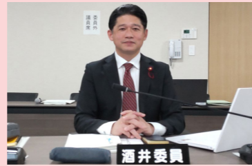
予算審査特別委員会にて

第1回定例会で審議された令和6年度予算は、各会派の代表質疑、および4日間に渡って開催された特別委員会での審査を経て、賛成多数で可決されました。(特に力を入れてきたテーマを中心に)新年度予算の概要を紹介します。(単位:千円)