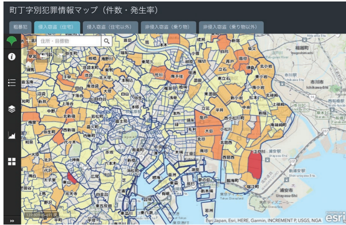
「見える化」のイメージ(東京都の防犯情報マップ)

市民や地域団体の皆さまが防犯意識を高め、主体的に防犯対策に取り組んで頂くためにも、町丁別の犯罪発生状況などを「見える化」することが重要であると訴えてきました。(左図:過去の議会質問で引用してきた東京都の防犯情報マップ)