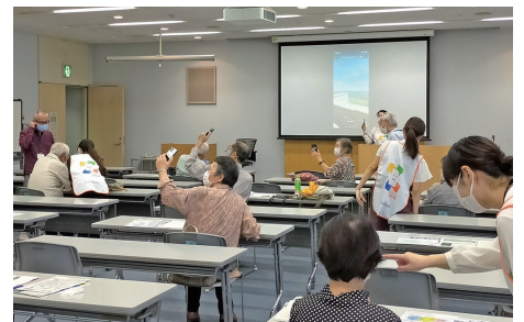
千葉市生涯学習センターでの体験会

今回の質問では、改めて「デジタルデバイド(情報格差)」解消に向けた取り組みを問いました。当局からは、「本年度は60歳以上の高齢者を対象とした初心者向け体験会や、地図機能の使い方等の講座を公民館や生涯学習センターで約50回開催する。来年度以降は今年度の事業を検証し、更なる内容の充実、支援する人材の育成など、デジタル活用を支援する施策を進める。」との答弁がありました。