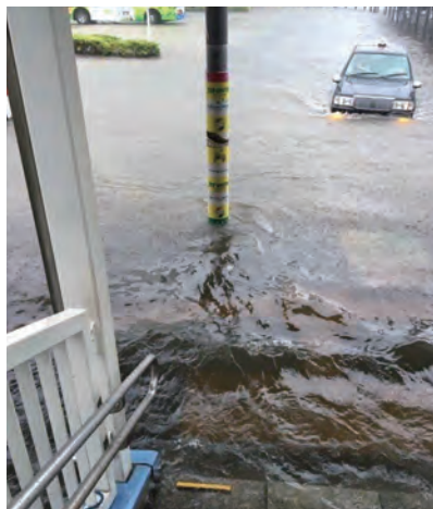
JR蘇我駅東口の階段下