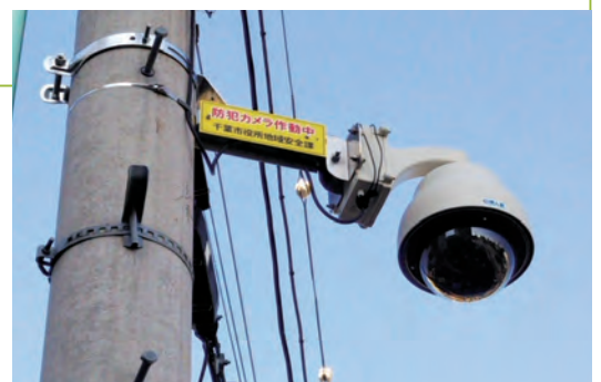
蘇我駅前に設置されたカメラ

「駅前にも防犯カメラを設置して欲しい」との声を頂き、平成26年6月、千葉市議会ですべて駅前等への「防犯カメラの設置」を主張。紆余曲折はありましたが、昨年、千葉駅及び稲毛駅周辺へ、今般、蘇我駅及び海浜幕張駅へ防犯カメラが設置されました。蘇我駅前については、東口に2ヶ所、西口に2ヶ所設置され、1月1日より運用開始されております。