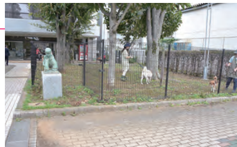
千葉市動物保護指導センター お散歩ボランティアの様子

今回は、人と動物との「共生の推進」をテーマに「動物介在教育の取り組み強化」「（ペットを飼養する）シニアへの支援」「地域猫活動への支援強化」に触れ、更には動物保護指導センターのあり方を問い「新たな施設の再整備」「ボランティアへの支援強化」「予算の抜本的な見直し」などを訴えました。また、前述の災害対応の質問の中で「災害時のペットの同行避難」についても取り上げました。