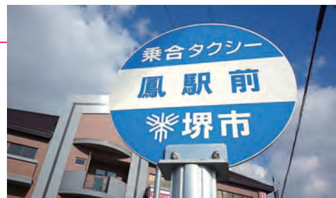
「堺市の乗合タクシー」の停留所