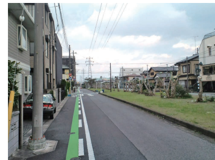
白旗グリーンベルト