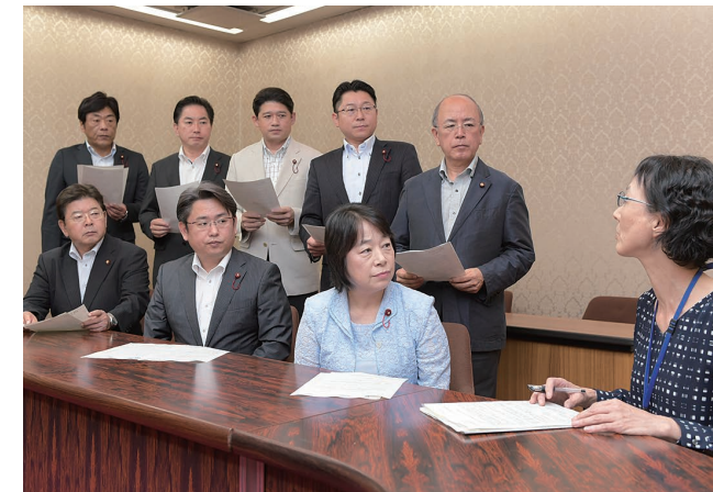
公明党市議団として教育委員会より詳細説明を聴取

千葉市では、市立小中学校に就学する児童生徒が安心して教育を受けられるよう、経済的理由でお困りの保護者に学用品費等の就学援助を行っております。このうち、中学校の入学準備金にあたる「新入学児童生徒学用品費等」及び「制服調整費(新中学1年生)」の支給時期が、これまで7月であったのに対し、新年度より入学に必要な諸用品を準備する3月に変更することが正式に決定致しました。 また、小学校の入学準備金前倒し支給についてはシステム改修が必要であるなどの事情から、平成31年度入学予定者から対応できるよう準備が進められることとなっております。