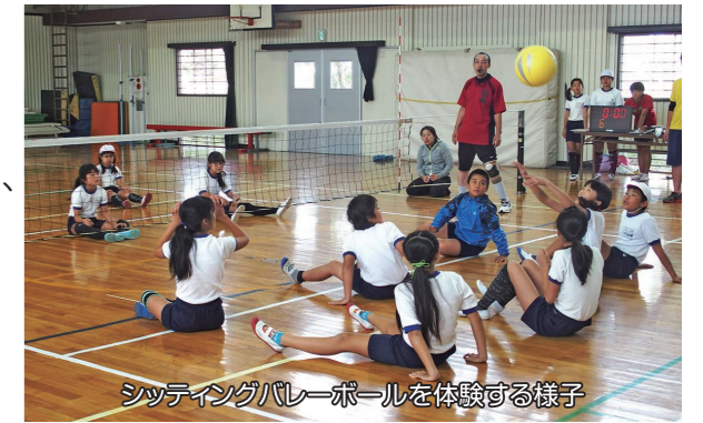
シッティングバレーボールを体験する様子

こうした取り組みが実り、千葉市の平成29年度予算では正式に事業化される運びとなりました。