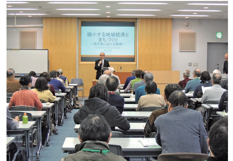
千葉市生涯学習センターでの講座受講の様子

市長答弁 社会教育の充実において中心的な役割を担うのが社会教育主事であり、地域の社会教育活動の活性化のため、ファシリテーション能力や地域の課題発見などの能力が求められている。今後、こうした能力を持つ人材の確保や育成をしていくとともに、多くの社会教育主事を適材適所に、かつ、継続的に配置していくためにも指定管理者制度の導入は有効な手段と考えている。また、これらを通じて職員の専門性を高めることで、公民館での地域づくりを担う人材の育成と学習成果の地域への還元が図られ、それにより本市の社会教育の充実が図られるものと考えている。