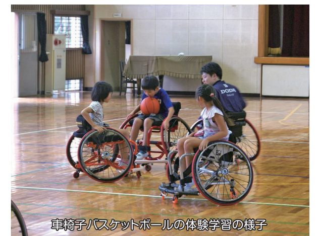
車椅子バスケットボールの体験学習の様子

また、歴史や意義についての学習、新たに開発した千葉市独自の教材を活用した道徳学習、さらに、トップスポーツチームとの交流やパラリンピアンとの交流、国際理解教育のための英語教材の検討等も行われます。