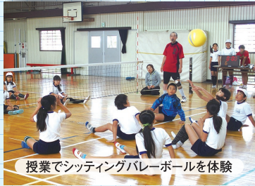
授業でシッティングバレーボールを体験

全小中学校でオリンピック・パラリンピック教育を実施。また、ボッチャ等の普及を促進。