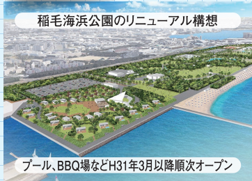
稲毛海浜公園のリニューアル構想